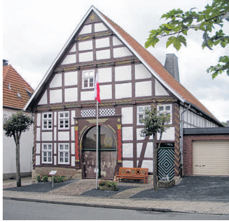
Das angeblich älteste Bürgerhaus von Obermarsberg, das Haus Böttcher, ist jetzt Teil der HSK-Museumslandschaft geworden.

Die umfangreiche, über Jahrhunderte angesammelte Geschichts- und Kultursammlung von Haus Böttcher wurde komplettiert durch weitere Fundstücke und Exponate aus der gesamten Marsberger Bevölkerung. Sie umfasst wertvolle Chroniken und Schriften, Stiche, Post-