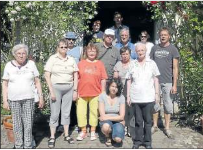
Die Marsberger Urlauber vor dem Jestädt Schloss.