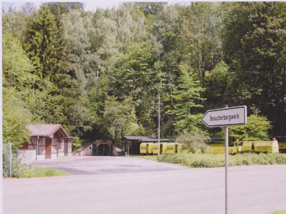
Das Besucherbergwerk Kilianstollen im August 2011

Vorsitzender des Marsberger Heimatbundes